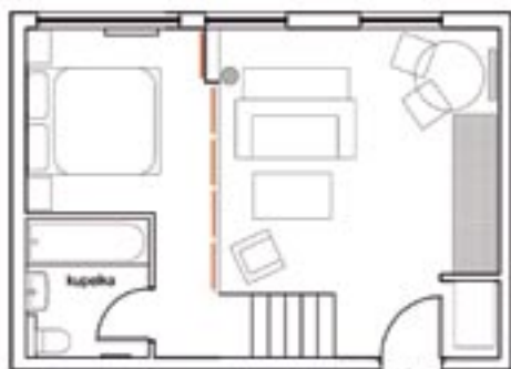
Zuzanin návrh bytu