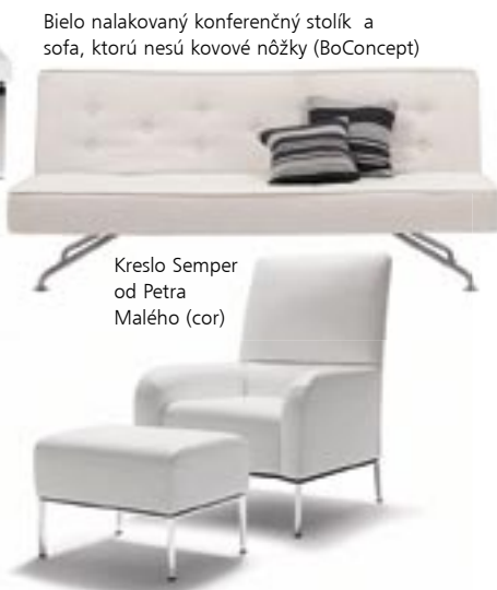
Bielo nalakovaný konferenčný stolík a sofa, ktorú nesú kovové nôžky (BoConcept)